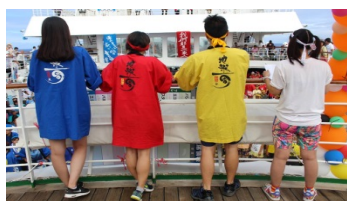
一百日的環球體驗 · 比旅遊走得更遠

Peace Boat 和平船 - 日本非政府組織(NGO)及非牟利組織(NPO)；三十多年以來，本著樹立友誼、和平共融、認識世界的理念，傲然成為聯合國經濟及社會理事會 ECOSOC 專門諮商資格的郵輪公司，策劃近一百個環球航程，與逾五萬名乘客覓歷多達二百個港口，不僅足立名城秘境，更心繫公益善舉，於一百日的航路上，終生學習並完美人生，與旅人攜手追風逐夢，拼砌豐盛的人生旅圖，留下一輩子的珍藏回憶。