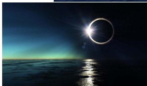
Ocean Dream 海洋夢想號